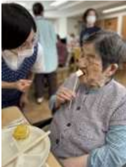
焼きマッシュマロは とても甘そうでした。

入居者様は、普段は見られないような笑顔をたくさん見せてくださり、参加した職員にとっても楽しい時間となりました。デザートには「焼きマッシュマロ」も用意されており大好評でした。また来年も開催できることを楽しみにしております。