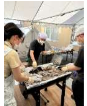
猛暑の中焼き場 お疲れ様でした。