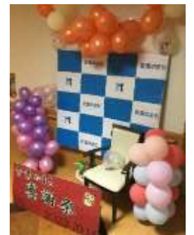
昨年の写真撮影ブース

現在、“青葉のまち感謝祭実行委員会”を立ち上げ、より多くのみなさまに楽しんでいただけるように、職員一同準備を進めております。詳細が決まりましたら、またお知らせさせていただきます。