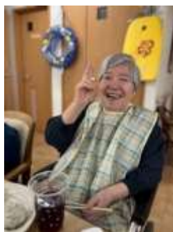
みなさま、とても良いお顔をされておりました。